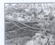
Queiroz Galvão vai fazer Via Mangue